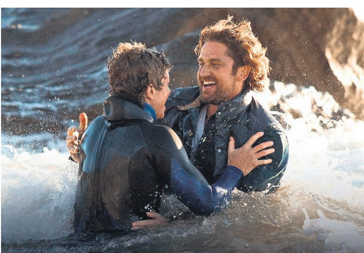
Картина оказывает зрителю многогранно-впечатляющее влияние. В исполнении Джерарда Батлера, справа — своему подопечному.

Маленького Джея Мориарти авторы сразу же характеризуют с наилучшей стороны, когда он не просто интересуется набегающими на берег волнами, но и рискуя жизнью, спасает из них собачку. А его самого, вымокше-