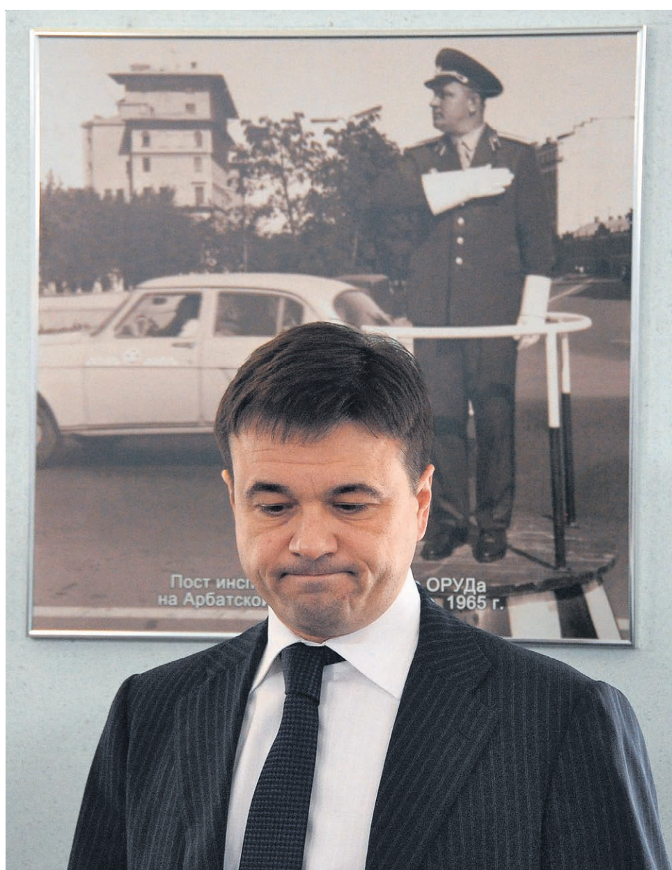
Один из ближайших соратников Сергея Шойгу по «Единой России» Андрей Воробьев стал его преемником на посту губернатора Подмоскovie

На протяжении десятка лет Андрей Воробьев ассоциировался прежде всего с партией «Единая Россия» и с главой МЧС, членом руководящих органов партии